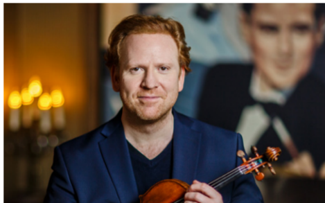
Daniel Hope

Bachfest im Advent Jauchzet, frohlocket, denn Vater Bach hat Himmlisches hinterlassen: weihnachtliche Festklänge, Concerti, Kantaten.