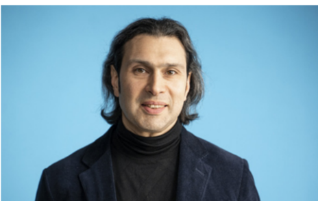
Vladimir Jurowski