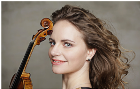
Julia Fischer

Hingabe mit Herz Ein schwüler Nachmittag, ein feuriger Abend, eine durchtanzte Nacht. Das RSB-Debüt des Spaniers lockt mit purer Leidenschaft.