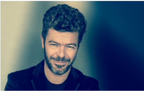
Pablo Heras-Casado