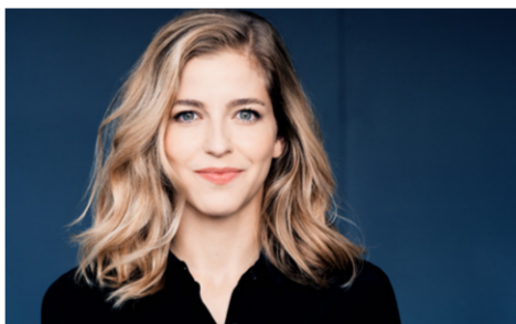
Karina Canellakis

Die englische Art Ekstase mit Understatement – Elgars großartiges Cellokonzert. Aufrichtiger Gentleman wird 150 – Vaughan Williams. Last but not least – Geheimtipp: Tippett!