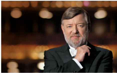
Sir Andrew Davis

Heiliger Zorn Nikodijevićs zartes Porträt eines Mädchens, getötet im Balkankrieg. Traurig und wütend Schostakowitschs Achte. Ungehört bis dato Firssowas Bratschenkonzert.